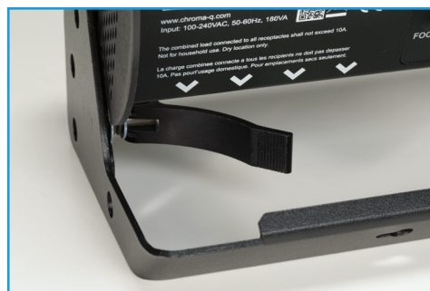
角度調整サイドレバー