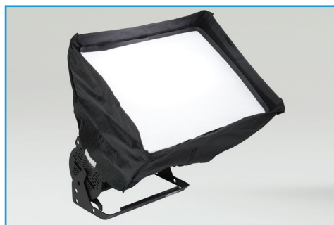
ライトバンクキット