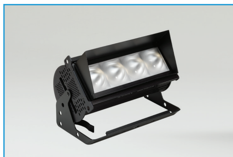
ハーフトップハット