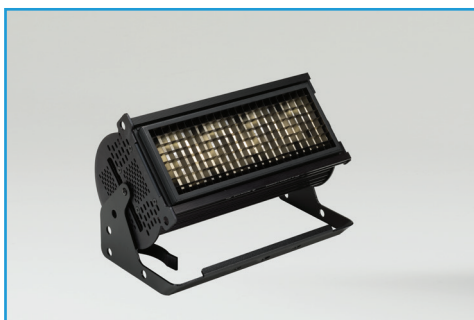
エッグクレートルーバー