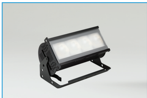
Cyc / Borderレンズ