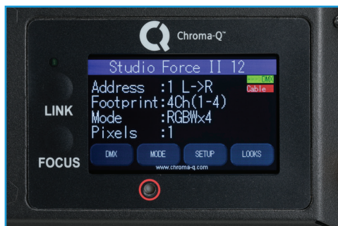
操作性の良い タッチディスプレイパネル

カラータッチディスプレイを搭載しています。オプションでワイヤレスLumen Radio CRMX内蔵タイプもございます。角度調整サイドレバーは内側についているので、機材同士の間隔を開けず真横に設置できます。