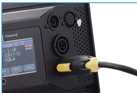
パワー、データコネクタ